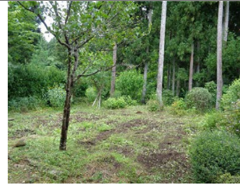
畑 + 山林