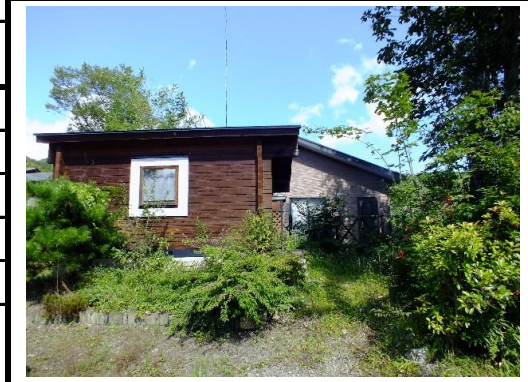
外観(前:別棟・奥:本棟)